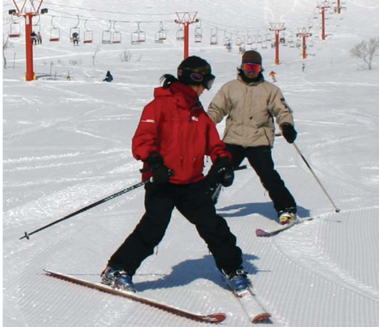
4th HALF DAY LESSON 50% OFF WITH MEMBERS CARD スタンプがたまると半日メニューが半額になるメンバーズカードあり