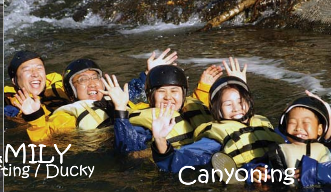
FAMILY Rafting / Ducky